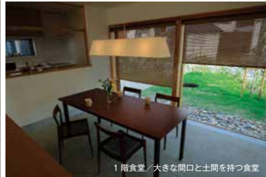
1階食堂／大きな開口と土間を持つ食堂