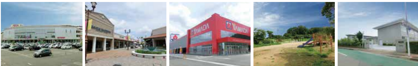
イオンモール神戸北 / 徒歩18分 (約1,500m) | 神戸三田プレミアム・アウトレット / 自転車7分 (約2,000m) | ヤマダ電機テックランド神戸北店 / 徒歩18分 (約1,500m) | 高津甲公園 / 徒歩1分 (約80m) | 神戸市立長尾小学校 / 徒歩8分 (約650m)