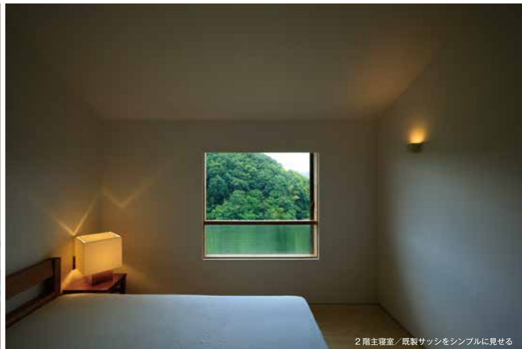
2階主寝室／既製サッシをシンプルに見せる