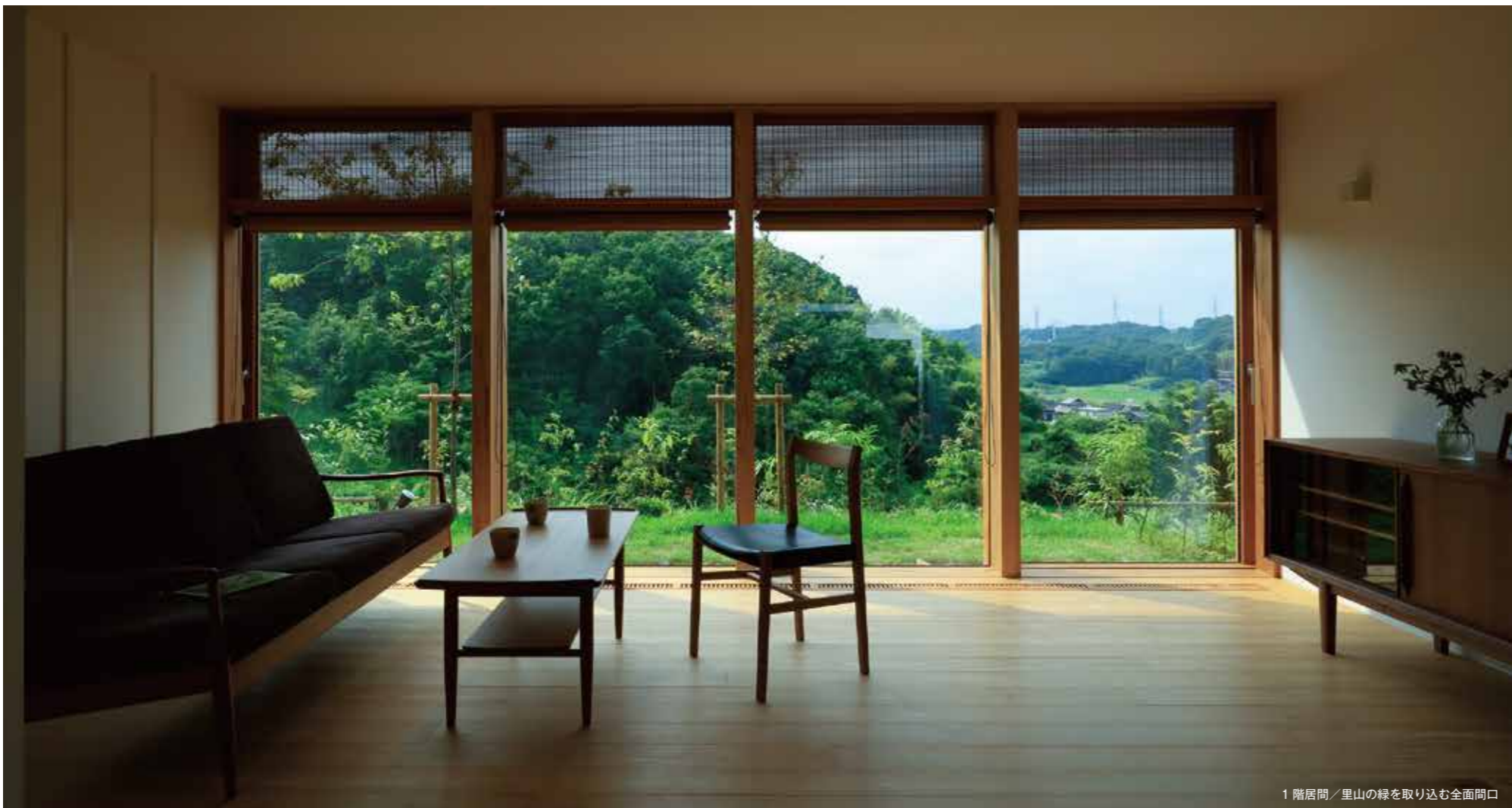
1階居間／里山の緑を取り込む全面開口