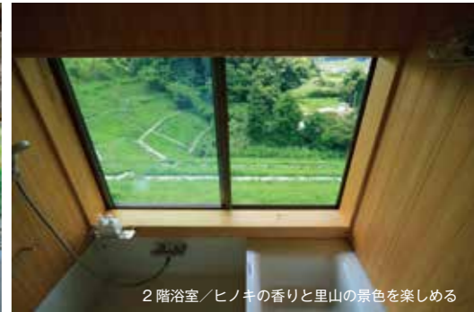
2階浴室／ヒノキの香りと里山の景色を楽しむ